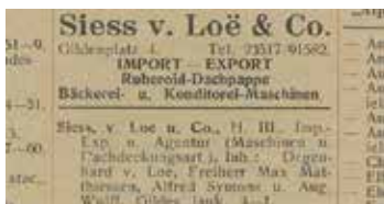
Telefonbuch Riga, 1926

Mit dem Standort in Steffin, der sich quasi fließend südlich an Wismar anschließt, hatte die Führungsriege von SILOCO 1992 eine perfekte Entscheidung beschlossen. Die Abfahrt zur Autobahn A 20 ist 5 Minuten, die Landeshauptstadt Mecklenburg-Vorpommern Schwerin 30 Minuten, Rostock und Lübeck jeweils 50 Minuten, Hamburg 80 Minuten und Berlin 160 Minuten entfernt. Auf über 5.000 Quadratmetern entstanden ein Büro, eine sehr gut ausgestattete Werkstatt und jede Menge Lagerhallen.