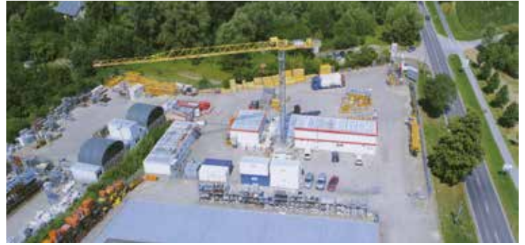
Seit 1992 gibt es die Niederlassung Steffin.

Neu im Trend sind die SILOCO SCUBE, die per Lkw an einen Ort für Events, wie zum Beispiel Konzerte, Ausstellungen, Public Viewing, Roadshows, Gartenpartys und Messen mit Ticketschaltern, Konferenzräumen, Showrooms, Umkleidekabinen und Sanitäreinrichtungen mit allen technischen Anforderungen geliefert werden. Dank verschiedenster Kombinations- und