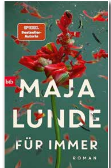
Maja Lunde, Für immer, Roman, 320 Seiten, btb Verlag, 24 Euro