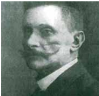
Dr. Hugo Unruh