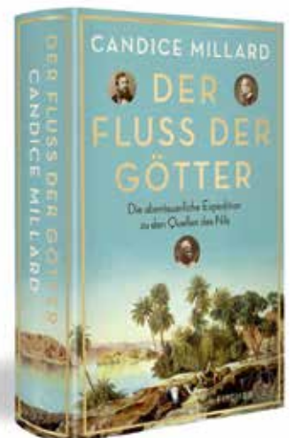
Candice Millard, Der Fluss der Götter, S. Fischer-Verlag, Expeditionsroman, 448 Seiten, Hardcover, mit Bildtafeln, 26 Euro