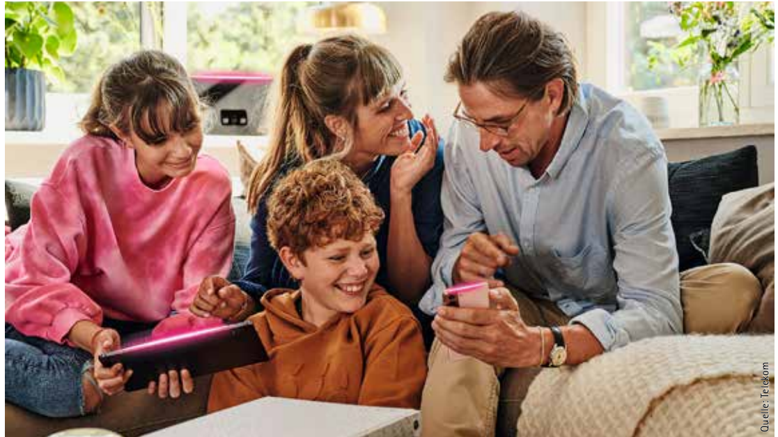
Für rund 11.500 Haushalte in Wismar baut die Telekom die Glasfaser aus.

Wichtig zu wissen: Sowohl Hauseigentümer, Verwalter und