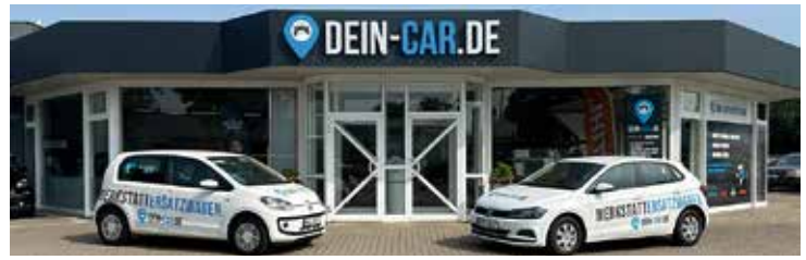
Firmengebäude im Gewerbegebiet Rothentor, Flinkerskoppel 3