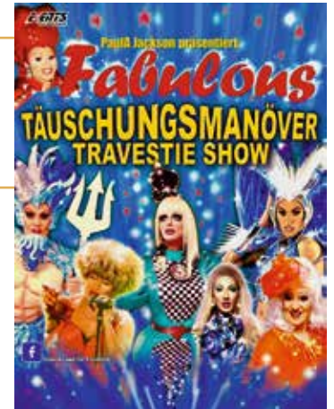
Travestieshow: Five Star events

23. November 2023 | Donnerstag | 19:30 Uhr