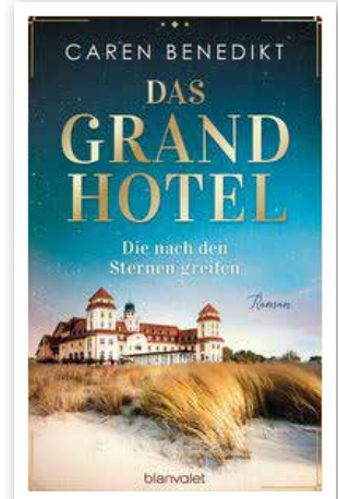
Caren Benedikt: Grand Hotel – Die nach den Sternen greifen | Ostsee-Roman | Blanvalet Verlag, 510 Seiten | Preis 15 Euro

Der Autorin Caren Benedikt gelingt dabei eine sehr subtile Darstellung bis hinein in die Nebenfiguren. Unter den vielen dicken Schmökern auf dem Buchmarkt ragt „Grand Hotel“ durchaus hervor und ist mit seinem Lokalkolorit für uns an der Küste natürlich besonders reizvoll. Volker Stein